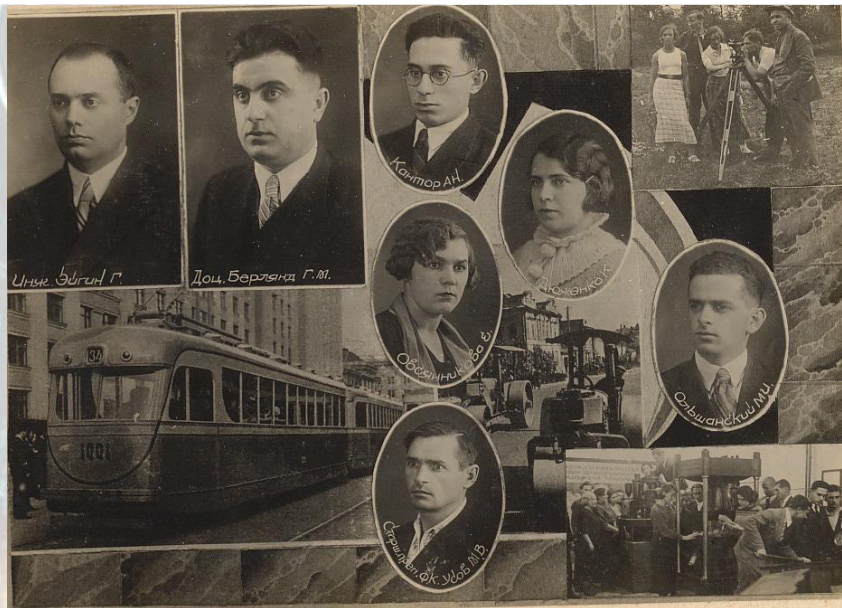
Випуск студентів ХІКБ 1938 р.